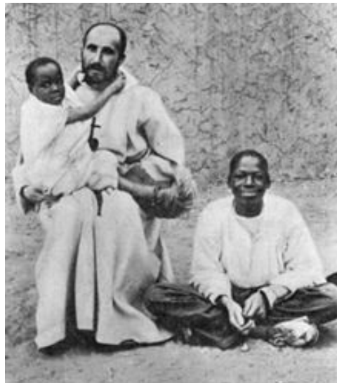
Carlos de Foucauld en 1902, fotografiado junto con esclavos que acababa de comprar para de inmediato liberarlos