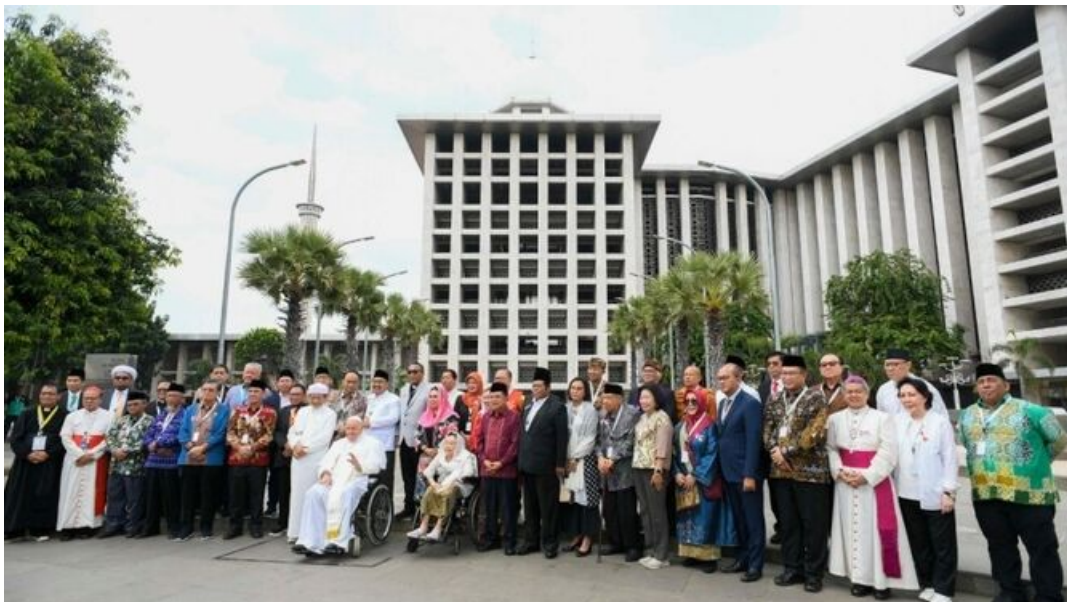
Foto de familia del Papa con los líderes religiosos en Indonesia Vatican Media

En el centro de la misión cristiana está el mandato de Cristo de "id y haced discípulos a todas las gentes" (Mt 28,19). Este mandato es coherente con la convicción de que Jesucristo es "el camino, la verdad y la vida" (Jn 14,6), en quien se encuentra la plenitud de la revelación divina. Sin embargo, la evangelización no es un acto de imposición , sino una propuesta libre, hecha desde el amor y el respeto.