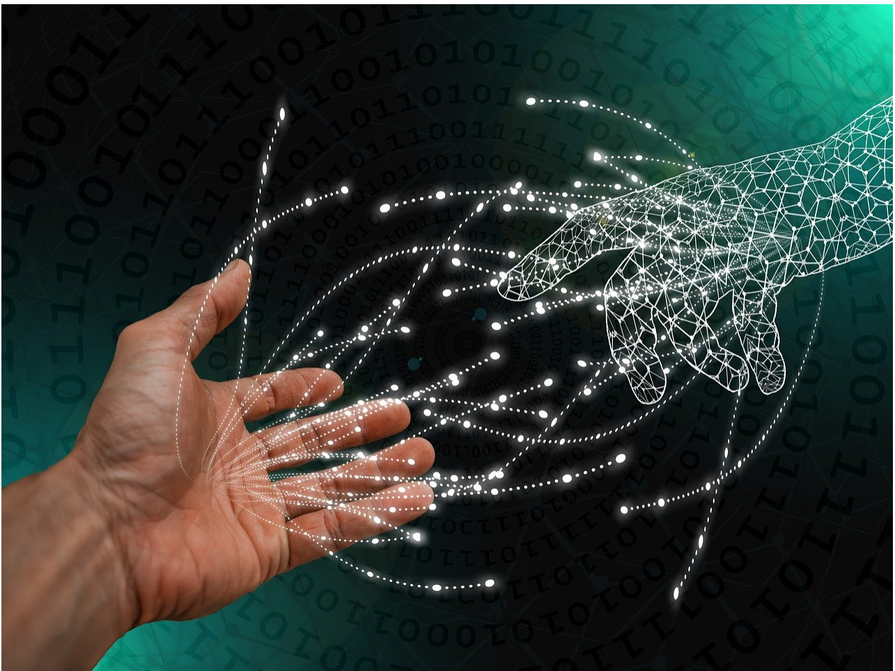
La Inteligencia artificial como constructora de paz

Durante el evento, Vincenzo Paglia destacó que la IA, con sus posibilidades ilimitadas, debe ser guiada por estar al servicio del bien común desde su diseño. Paglia subrayó la importancia de la paz y la reconciliación, especialmente simbólicas en una ciudad como Hiroshima, y afirmó que la tecnología puede ser un motor de paz si se trabaja conjuntamente con ética.